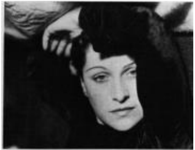
Portret van Dora Maar door Man Ray

nl.wikipedia.org/wiki/Pablo_Picasso 1881 – 1973