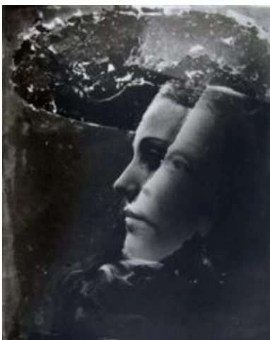
Dubbelportret Dora 1930 Meer info: en.wikipedia.org/wiki/Dora_Maar