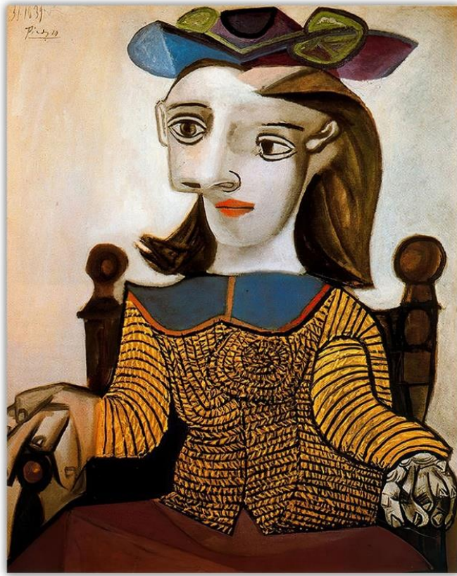
Pablo Picasso: De gele trui