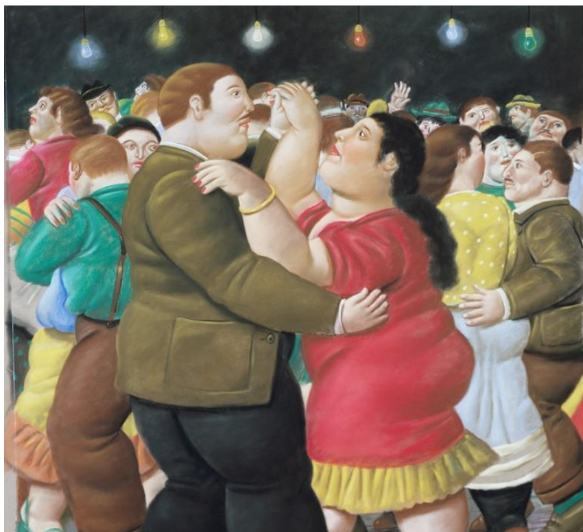
Fernando Botero: Dansen Deventer Huisgenoten Maart 2022